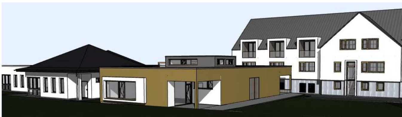
Der Zubau entsteht hinter dem Gemeindehaus.

Als Bürgermeister der Gemeinde Kirnberg freut es mich, in die Zukunft der Familien in Form eines Kindergartenzubaus investieren zu dürfen.